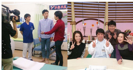
足の専門家としてSTSサガテレビの かちかちPressに出演！