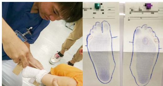
幼稚園や子育てサロンなどで足の講習会