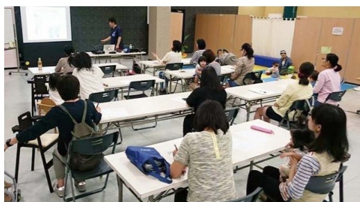
靴と足と姿勢の講演会