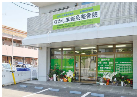
▲緑の看板が目印、お気軽にご相談を！