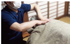
◀自宅ではり・きゅう・マッサージに加えて転倒・寝たきり予防を行っています。

最近、父・母の体の衰えを感じたことはありませんか？体操教室に元気が通っていた母が自粛の影響でめっきり体操教室にいけなくなりました。最近、父・母の体の衰えを感じたことはありませんか？体操教室に元気が通っていた母が自粛の影響でめっきり体操教室にいけなくなりました。