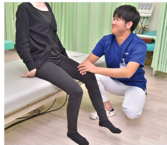
▲外出を控えられている方も、ご自宅で転倒予防・歩行リハビリを行えます。