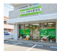
▲なかしま鍼灸整骨院の施術がご自宅で、まずはお電話ください。

「スタッフが感染症予防対策を徹底して訪問しますので安心してご利用いただけます。地域密着型の整骨院として10年間歩んできた私たちどうぞお任せください！」。